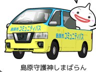
島原守護神しまぼらん

たしる号は、指定の停留所で乗降する予約制の相乗りバスです。市内各地区の多くの場所に停留所があります。1回200円で利用できますが、南エリア(安中~杉谷)と北エリア(霊丘~有明)では乗り換えが必要です。